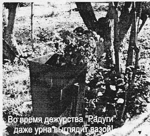
Во время дежурства "Радуги" даже урна выстлает вазой!