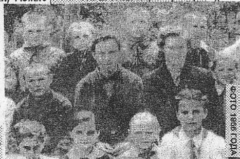
Азовской сельской администрации